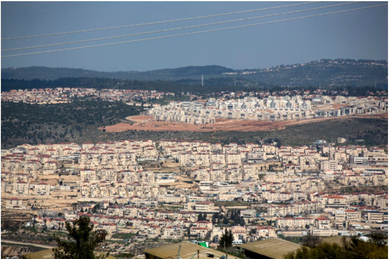
! Vue sur la colonie israélienne illégale de Beitar Illit, en Cisjordanie 11 mars 2019.

Des rapports 65 de plusieurs ONG ont confirmé que toutes les banques israéliennes sont impliquées dans l'industrie de colonisation israélienne - à titre d'exemple, elles accordent des prêts spéciaux pour des projets d'entreprises, du gouvernement ou d'individus dans les Territoires palestiniens occupés. Les cinq banques israéliennes dans lesquelles AXA est actionnaire ne font pas exception.