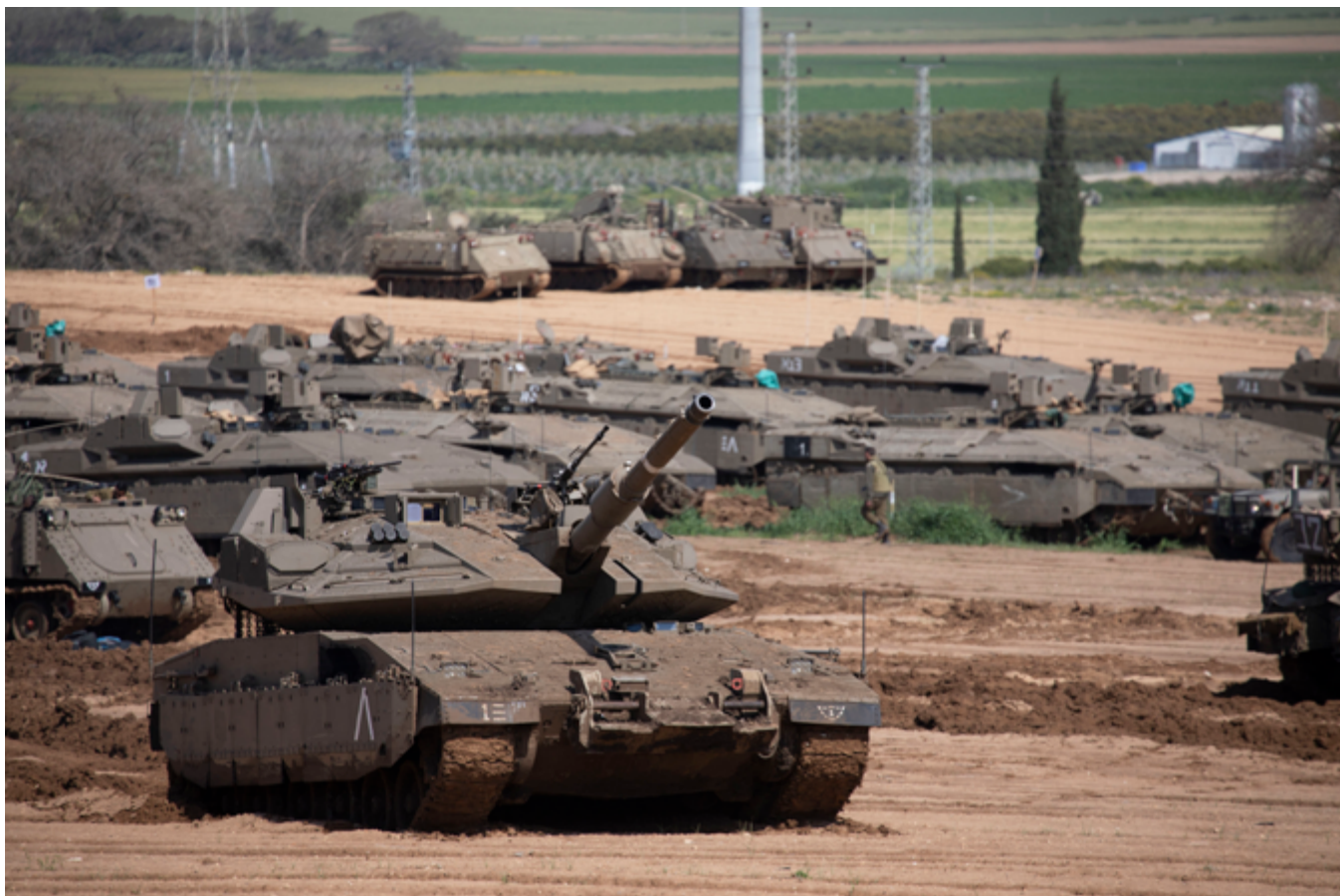
Chars et véhicules blindés de transport de troupes israéliennes dans une zone ouverte près de la frontière avec Gaza, dans le sud d'Israël, le 26 mars 2019.

AXA a une « Politique de groupe sur les armes controversées 47 » qui indique que le groupe a pris des mesures pour mettre fin à ses liens avec les fabricants de bombes et balles à sous-munitions, d'armes chimiques et biologiques et de leurs composants. En outre, « AXA Investment Managers (IM) a pris la décision de céder les fonds qu'il gère dans les entreprises qui produisent ou vendent (...) des bombes à sous-munitions 48 ». Le secteur de l'armement étant un secteur d'activité qu'AXA s'était engagé à quitter en 2007 49 .