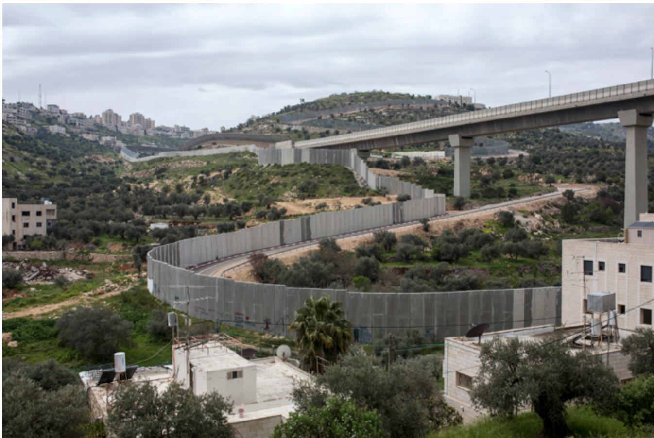
Une vue sur le Mur de l'Apartheid construit près de la route 60, dans le quartier de Bir Ouna, à Beit Jala, Cisjordanie, le 6 avril 2019. La construction du mur illégal a privé Beit Jala d'une grande partie de ses terres agricoles, restées de l'autre côté du mur.

de maisons à l'aide d'équipements blindés, des arrestations massives, en plus du blocus et des bombardements à grande échelle subis par la bande de Gaza en 2009, 2012, 2014 59 .