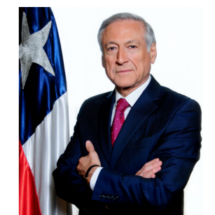
Heraldo Muñoz Valenzuela Ministro de Relaciones Exteriores

Este Plan de Acción Nacional de Derechos Humanos y Empresas busca ser un aporte en ese camino de desarrollo sostenible.