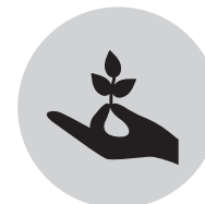
DEFENSORES DEL MEDIO AMBIENTE Y DEL DERECHO A LA TIERRA