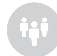
PERSONAS DEFENSORAS DE LOS DERECHOS DE LAS MINORÍAS