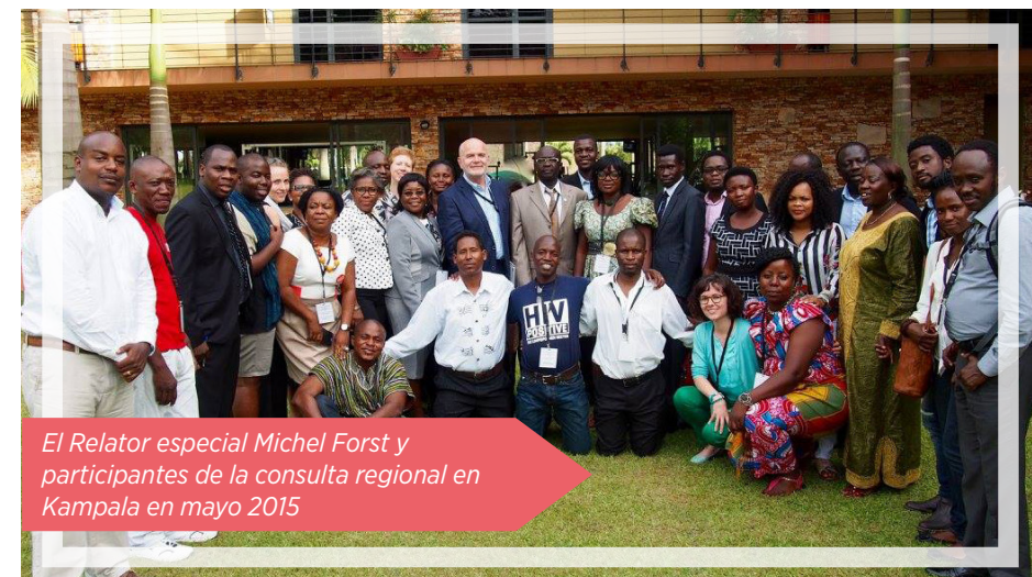
El Relator especial Michel Forst y participantes de la consulta regional en Kampala en mayo 2015

Defensoras y defensores confirmaron estas tendencias en diferentes consultas y es particularmente preocupante que los gobiernos estén copiando los métodos de los gobiernos más represivos en la materia.