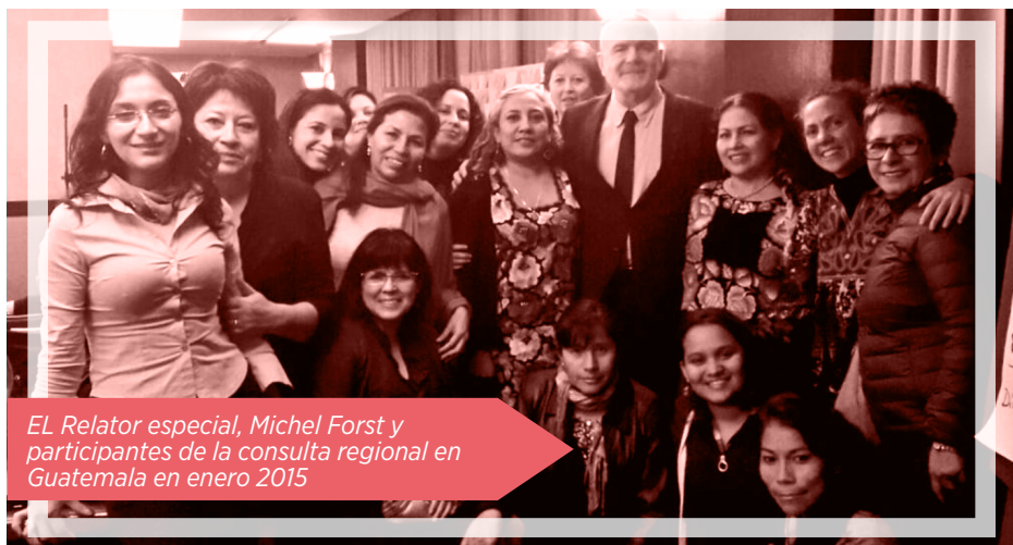
EL Relator especial, Michel Forst y participantes de la consulta regional en Guatemala en enero 2015

Por otro lado, las defensoras denunciaron las lagunas en las respuestas de los distintos mecanismos y organizaciones , que no tienen suficientemente en cuenta la perspectiva de género (por ejemplo, en los programas de relocalización, de los que a menudo están excluidas las familias). Las defensoras señalaron también la necesidad de que se las involucrara en la elaboración de los programas de protección de las que eran destinatarias, para alejarse de una visión a veces paternalista y reductora de los desafíos a los que se enfrentan.