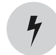
PERSONAS QUE DEFIENDEN LOS DERECHOS HUMANOS EN ZONAS DE CONFLICTO O QUE SALEN DE UN CONFLICTO