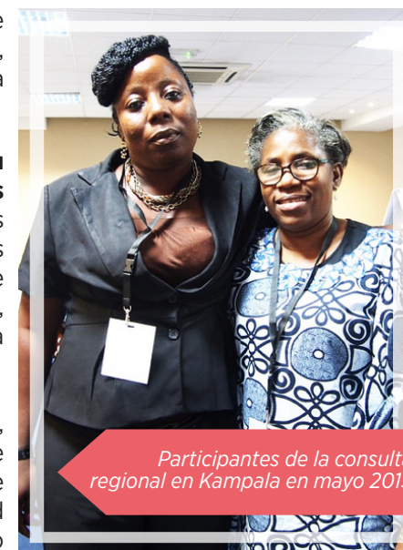
Participantes de la consulta regional en Kampala en mayo 2015

En las consultas, numerosas personas defensoras recordaron los insultos que recibían las defensoras, a las que en ocasiones se presentaba como prostitutas o personas inmorales, transgresoras o contrarias al respeto de los valores tradicionales. Según las defensoras, eso las convierte en blanco prioritario de grupos religiosos, en particular cuando defienden el respeto y la promoción de los derechos sexuales y reproductivos.