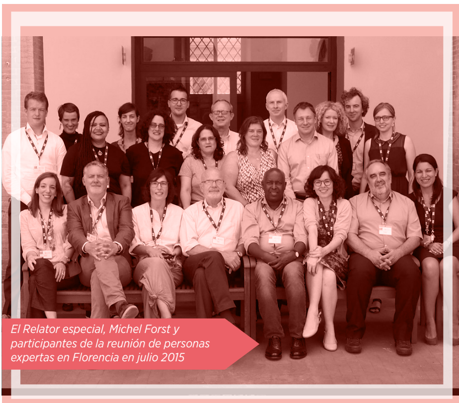
El Relator especial, Michel Forst y participantes de la reunión de personas expertas en Florencia en julio 2015

Sin embargo, los testimonios fuertes y en ocasiones estremecedores que el Relator especial ha escuchado de boca de tantas defensoras y defensores influirán sin duda en sus próximos informes y en la elección de los países que deseará visitar.