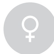
DEFENSORAS DE LOS DERECHOS HUMANOS