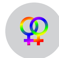
PERSONAS DEFENSORAS DE LOS DERECHOS DE LAS PERSONAS LESBIANAS, GAYS, BISEXUALES, TRANSGÉNERO E INTERSEXUALES