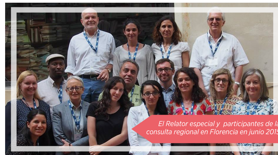
El Relator especial y participantes de la consulta regional en Florencia en junio 2015

Por último, por lo que se refiere a los pueblos indígenas, numerosas defensoras y defensores de América Latina subrayaron la inexistencia de un marco jurídico e institucional que reconozca los derechos de esas comunidades o que permita su aplicación efectiva cuando se reconocen.