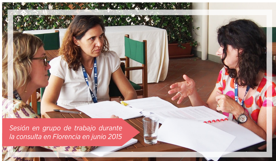
Sesión en grupo de trabajo durante la consulta en Florencia en junio 2015