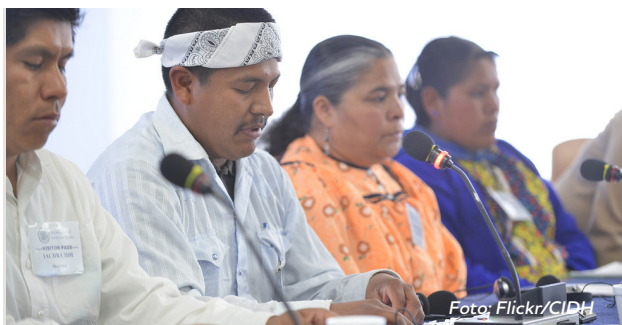
Líderes indígenas de las montañas de la Sierra Tarahumara en Chihuahua presentan sobre la situación de derechos humanos y de seguridad de sus comunidades en una audiencia pública de la CIDH en 2013.

En regiones como la Sierra Tarahumara, las medidas de protección seguirán siendo insuficientes mientras el gobierno mexicano no aborda las problemáticas de fondo en cuanto a las causas que defienden las comunidades y personas defensoras de derechos humanos y periodistas.