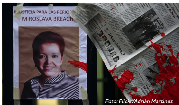
Manifestación en la Ciudad de México exigiendo justicia para el asesinato de la periodista Miroslava Breach.

y a veces omisa para ejercer la facultad de atracción. Por ejemplo, en el caso de la periodista Miroslava Breach, quien fue asesinada en marzo de 2017 en el estado de Chihuahua, la FEADLE inició de inmediato una investigación paralela, pero rechazó atraer el caso por más de un año a pesar de las preocupaciones sobre la imparcialidad de la Fiscalía General de Chihuahua y sobre las violaciones que la misma estaba cometiendo en perjuicio de los familiares como su negativa a reconocerles su calidad de víctima y el derecho al acceso a la investigación. No fue hasta abril de 2018 que la FEADLE finalmente logró fijar su competencia para conocer el caso. Esto, luego de una intensa batalla jurídica y presión por parte de la organización Propuesta Cívica, representante jurídica de la familia Breach 74 .